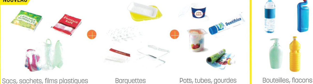
Sacs, sachets, films plastiques