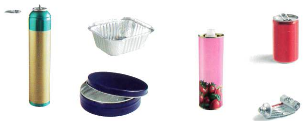
Bouteilles, aérosols d'hygiène et alimentaires, conserves, canettes