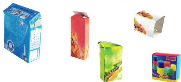
Cartonnettes et briques alimentaires